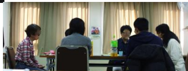
若者のための「デス＊Cafe」